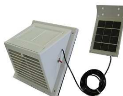
分離式太陽電池 (ASV103, 104 のみ 付属)