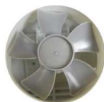
吸気用ファン（灰色） (吸気・排気を切り替え用)